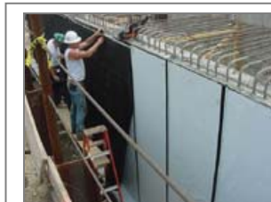
Užberiami gruntu pamatai