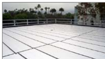
Sutapdintų plokščių perdenginiai, terasos, parkingai, balkonai