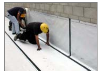
Mūrinės, blokelių sienos